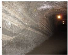
② 赤山地下壕内の断層地形