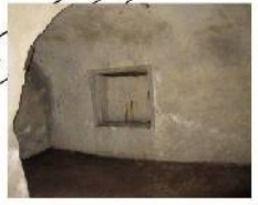
② 赤山地下壕内の「奉安殿」