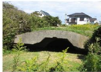
③ 河岸段丘を利用して掩体壕をつくった!