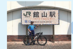
⑩ 館山駅西口 (ゴール)