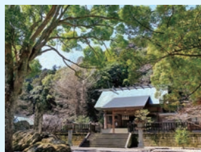
③ 安房神社 安房国一之宮 開運のパワースポット 約3.5km (約14分)