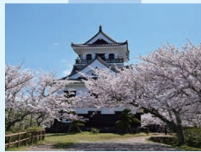
⑧ 城山公園 戦国武将里見氏の城跡 約1km (約4分)