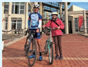
④ アロハガーデンたてやま ハワイをテーマにした動植物園 約6km (約24分)