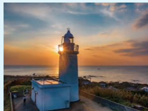
⑦ 洲崎灯台 房総最西端の灯台 約10km (約40分)