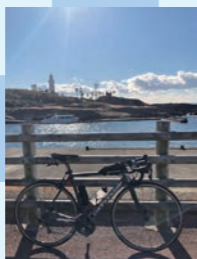
② 野島埼灯台 房総最南端の灯台 約10km (約40分)