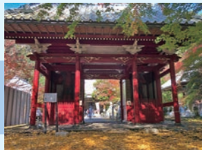
① 小松寺 秋の紅葉が美しい名刹 約10km (約40分)