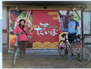
⑤ 漁港食堂だいぼ 伊予漁港にある 花しびきリゾート直営の「網元」 約3km (約12分)