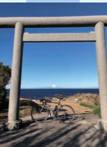
⑥ 洲崎神社 安房国一之宮 源頼朝が戦勝祈願した神社 約0.5km (約2分)