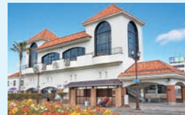
⑩ 館山駅西口 (スタート)