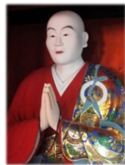
雄誉霊巖上人像（大巖院蔵）

浄土宗総本山・知恩院（京都市）の第32世となり、3代将軍徳川家光の庇護のもと大火後の再興を果たし、日本一の大鐘を鑄造した。全国に3,000人を超す弟子をもち、熱心な信者に支えられ、各地に多くの寺院を建てた。安房国から伯耆国（鳥取県倉吉）へ改易された里見忠義を訪ねたといわれる。