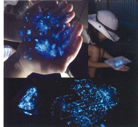
手の上で発光体験